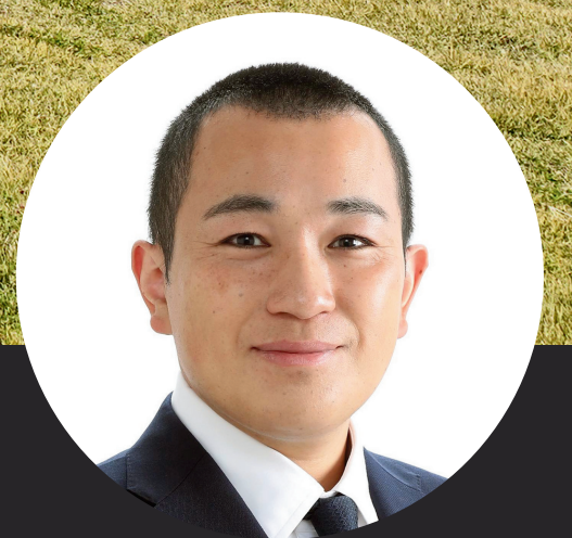
飛騨市教育委員会