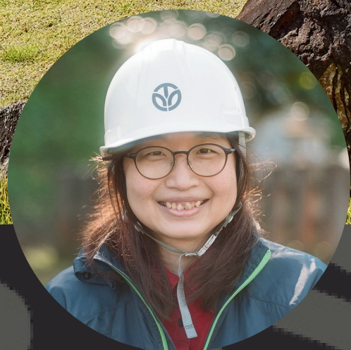
福井県立一乗谷朝倉氏遺跡博物館