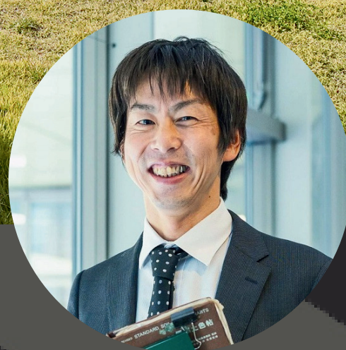
飛騨市教育委員会