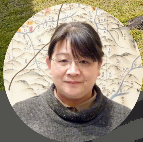
岐阜市歴史博物館