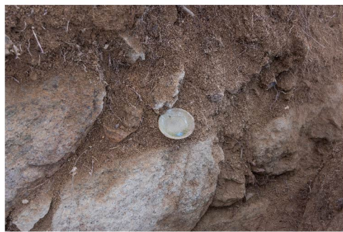
古川城跡 瀬戸美濃焼出土状況

姉小路氏城館跡の発掘調査で出土した遺物を中心に紹介します。飛驒地域の遺跡から出土した遺物を合わせて展示し、武将の暮らしを概観します。